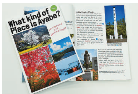
英語部は昨年、市を紹介する冊子を作成し、各所に寄贈。観光協会のホームページで閲覧できます

英語部は月2回、例会を開催。ネイティブスピーカーを交えて、英語を学びながら文化交流を深めています。日本語交流部は週1回、日本語教室を開催。ボランティアが、外国人個々のレベルに応じ日本語を教えています。昨年は、日本語学習者とともに、市が発行する「守ろうごみマナー」