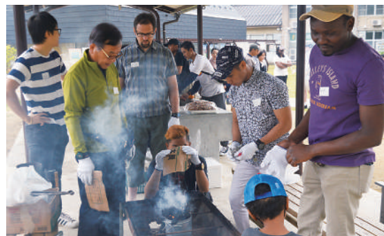
6月に開催したパーティーには60人が参加し、大いに盛り上がった

に恒例のクリスマスパーティーや新春パーティーの開催を計画。今後、参加者を募集しながら、国際理解への一歩を踏み出しませんか。