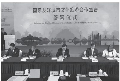
「国際友好都市文化観光協力の発展を目指す」ということを目指している

行政・市民で友好促進 本市の公式訪問は、平成26年以来5年ぶり。今回の訪中は、6月1日に来続した焦市長Ⅱ本紙6月号掲載Ⅱからの招待を受け実現しました。6月に本市で開催した記念式典では、両市が友好宣言書に署名し「平和友好」「平等互惠」「相互信頼」「長期安定」の原則を再確認。今後も、行政や市民同士の交流を進めます。