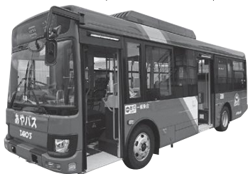
7月21日、上林線の中型バス1台を更新。段差がないバリアフリーのノンステップバスになりました

全区間が乗り放題でお得です。同定期券は▽市役所市民協働課▽あやベ観光案内所(駅前通り)▽上林いきいきセンター(八津合町)で購入できます。初回購入時は、年齢が確認できるものを持参してください。