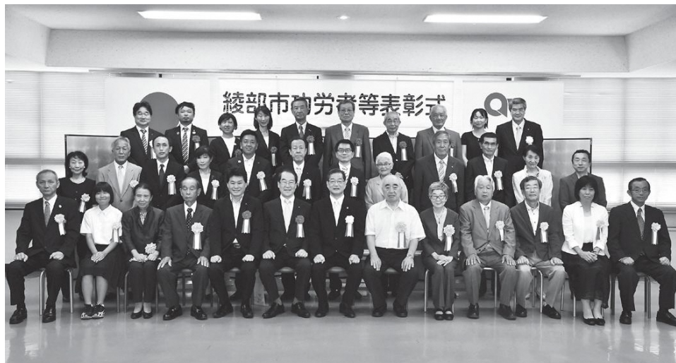
被表彰者の皆さん

市は8月2日、功労者等表彰式を開催。功労者4人、篤志者3人・3団体、分野別功績者9人・3団体、善行者2人を表彰しました。被表彰者は次の皆さんです(敬称略、50音順)。