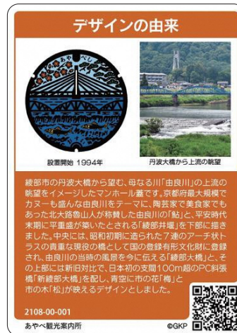
カードのマンホール蓋は、綾部浄化センター(高津町)にあります

美しい由良川の風景をデザイン 本市は、下水道事業への関心と理解を深めてもらうためにカードを作成。名刺よりひと回りほど大きいサイズで、両面カラー、4000枚を発行します。マンホール蓋のデザインになっっているのは丹波大橋からの由良川上流の眺望II写真右下。府最大規模の「由良川」をテーマに▽北大路魯山人が称賛した由良川の「ア