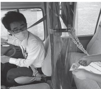
定期券を利用するときは、券面をしっかりと乗務員に見せるだけ。現金での支払いが不要で便利です

半額キャンペーンの対象は、65歳以上の人が利用できる「健康長寿定期65」です。キャンペーン期間中の9月1日(水)〜30日(木)は、通常1か月3000円のところ、半額の1500円(複数月分を購入の場合、1か月分のみ対象)。あやバス全線・