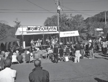
東八田フェスティバルの様子。屋外に舞台を設置し、子どもたちの演奏やビンゴゲームなどにぎわいます

—東八田の自慢を教えてください— 足利尊氏生誕の地である安国寺や標高664㍎の弥仙山、黒谷和紙など、歴史ある建物や産業、祭りなどもあって郷土色豊かなところです。黒谷和紙は800年前に平家の落ち