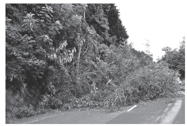
7月豪雨の被災箇所。今後も復旧を最優先に取り組みます

基金（貯金）残高は、前年度より5224万円増え、39億1432万円でした。事業の見直しや市債の追加発行により、財政調整基金の取り崩しを回避したためです。一方、市債残高は、前年度比5億8795万円増の144億9102万円。3年連続で増加し