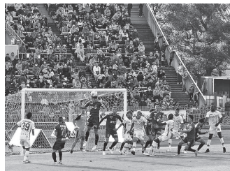
懸命に戦う京都サンガをスタジアムで応援しよう！

Jリーグで最古の歴史 京都サンガは、大正11年に京都師範学校（現京都教育大学）の卒業生が創立した紫光