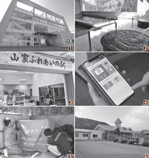
①市民センターを整備 ②あやべ温泉をリニューアル ③「駅再生プロジェクト」でR山家駅周辺のにぎわいを創出 ④聴覚・言語障害者向けの緊急通報システムを整備 ⑤各地区公民館に土のうステーションを設置 ⑥物部保育園の園舎を改修