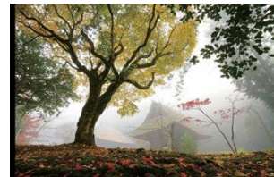
綾部市文化協会賞 かやぶきの寺 岩王寺 白木勇治（福知山市）