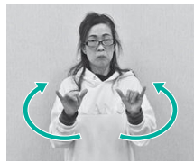
③2指（親指・小指）を立て、小指側から親指側へ円を描く（社会の意）