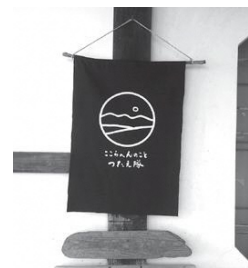
濃紺に白色で里山の風景をデザインしています