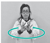
②両手の2指の輪をつないで、円を描く（つながるの意）