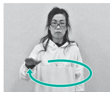
①手のひらを下に向け円を描く（みんなの意）