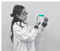
④左手の指を丸めて体の前に置き、右手人差し指を当てる（ねらいの意）