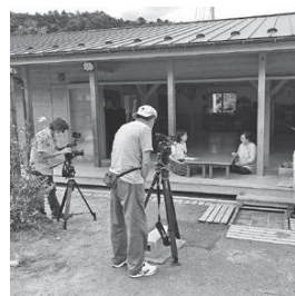
地域で活動する人にインタビューを行い、現場の声を多数収録しています

本年度の取り組みとして、希望者への情報発信を目的に、各リーダーが内容を企画し、12地区を紹介する動画「あやべのここにへん」Ⅱ5面上Ⅱを作成。地域の人口や学校、施設、公共交通機関などを紹介しています。各地区で生活するリーダーならではの視点で、地域の魅力を7分間の動画に凝縮。綾部での暮らしを具体的にイメージできる内容に仕上がっています。