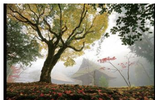
綾部市文化協会賞 かやぶきの寺 岩王寺 白木勇治（福知山市）