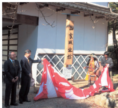
11月3日に行われた看板の除幕式

利用案内 歴史資料館の見学は、事前に電話予約必要 山家公民館 ☎(46) 0345