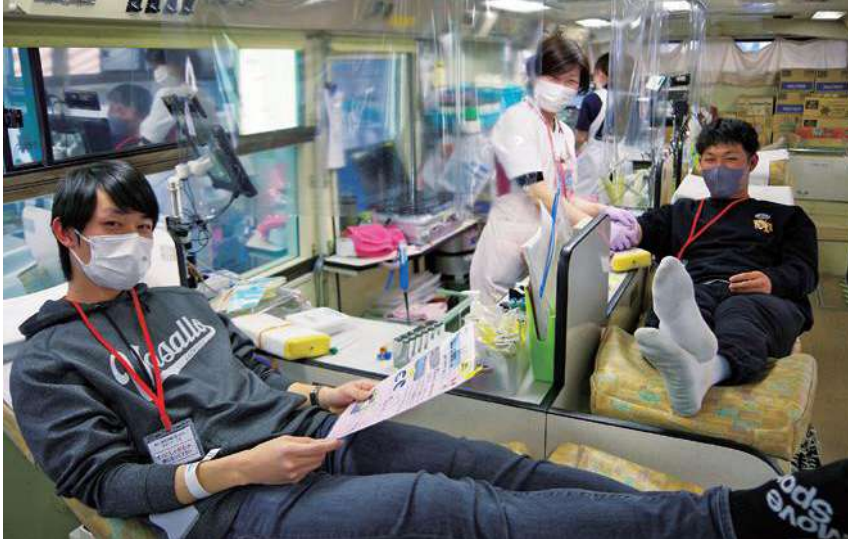
献血バスの中の様子

献血は、病気の治療や手術などで輸血が必要な人の尊い命を救うため、健康な人が自らの血液を無償で提供するボランティアです。昭和39年、献血を国と地方公共団体、日本赤十字社の3者が主導することを閣議決定。その翌年に同協議会が発足しました。同協議会は府や市、医師会、自治会連合会等の関係団体で構成。発足から半