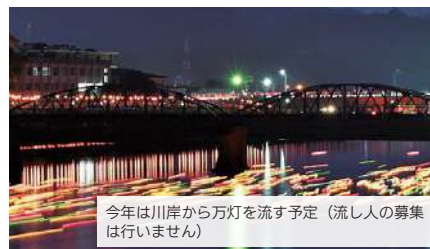
今年は川岸から万灯を流す予定（流し人の募集は行いません）