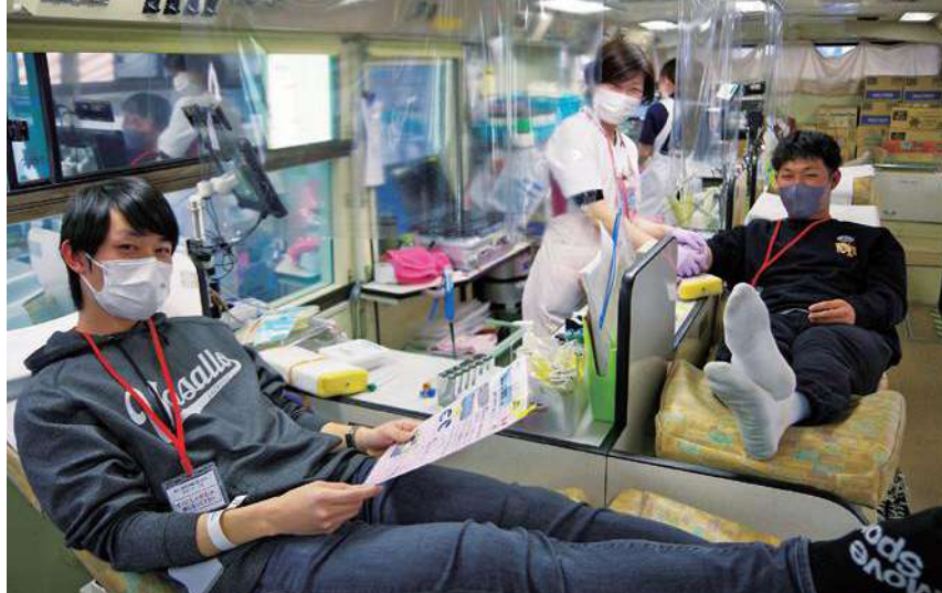
献血バスの中の様子