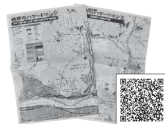
市のホームページに掲載しているほか、防災・危機管理課でも確認できます

大切な命を守るためには、複数の情報入手手段を持つことが重要です。市は、防災行政無線▽防災ラジオ（FM）▽FMいかる、防災ラジオ▽あやべー▽緊急速報メール（エリアメール）▽市ホームページ▽フェイスブック▽LINE▽ライフジョン▽Yahoo!防災アプリなどで情報を発信します。これらは状況によって、利用できなくなるものもあります。日頃から、情報の入手方法を確認しておきましょう。