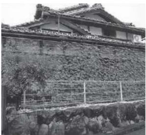
室内や建物への日差しを遮ります

人の活動から排出される温室効果ガスの増加で、地球温暖化が進んでいます。温室効果ガスとは、二酸化炭素やメタン、フロンガスなどの総称。二酸化炭素は温室効果ガス全体の約4分の3を占めています。