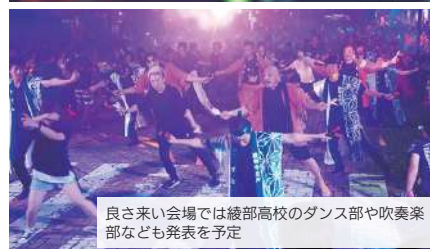
良さ来い会場では綾部高校のダンス部や吹奏楽部なども発表を予定