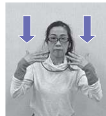
夏 (B) 両手の指先をこめかみから下へ下ろす(汗をかく様子)