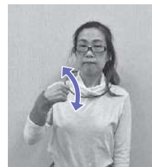
夏 (A) 親指を人差し指に乗せた握り拳で、首筋あたりをあくぐ(うちわであおぐ様子)