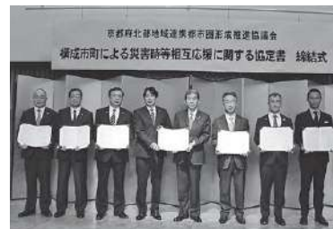
府北部5市2町は5月11日、水害など災害時の応援協定「災害時等相互応援に関する協定」を締結しました

避難に関する情報には、気象庁が出す警報や注意報などの気象情報と、市が出す避難指示などの避難情報があります。避難のタイミングを伝えるために用いる警戒レベルは5段階。レベルごとに住民