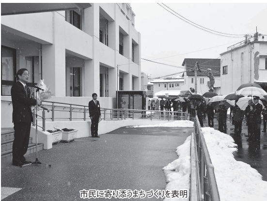
市民に寄り添うまちづくりを表明