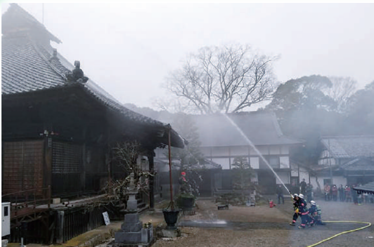
市消防本部は毎年、文化財のある寺社等や事業所と訓練を実施。防火意識の高揚に努めています。(写真は1月21日、正暦寺で)