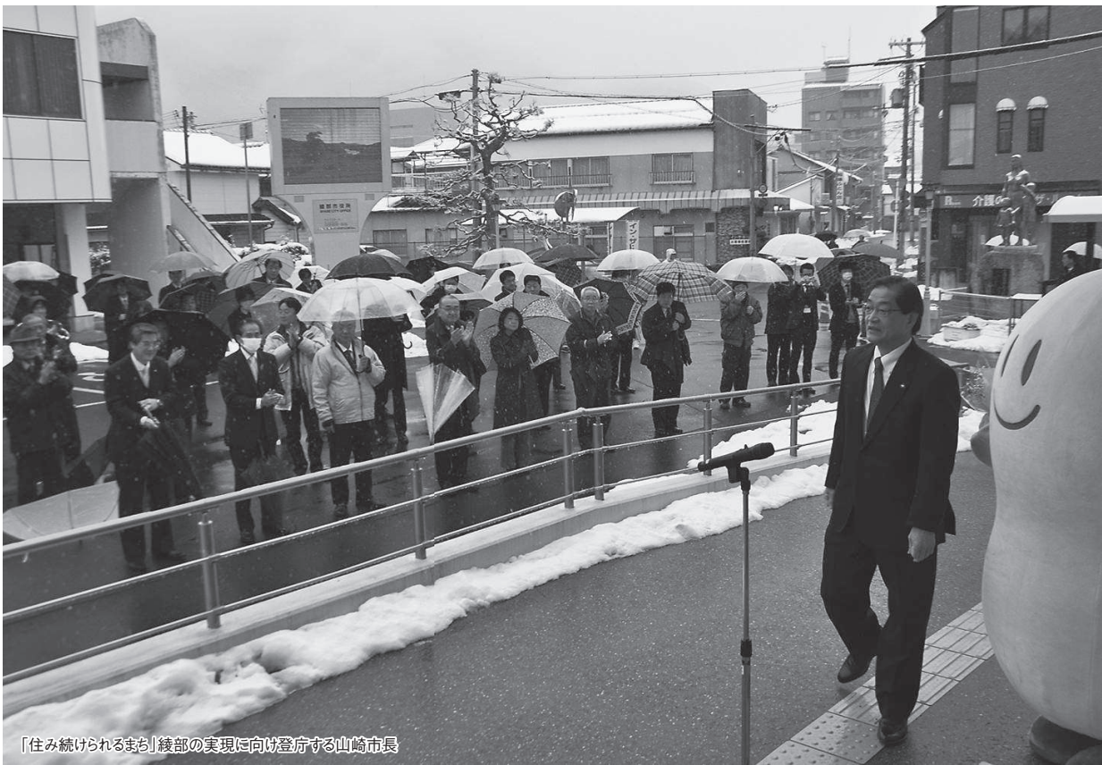
「住み続けられるまち」綾部の実現に向け登庁する山崎市長