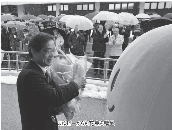
まゆび一から花束を贈呈

特性を国・府に伝え、議論して、施策に反映させる役割があります。そのためにも、職員一人ひとりが国や府と信頼関係を築く意識を大切にしてください。 綾部には今、2つの良い風が吹いています。1つは企業立地や物流など高速道路網の完成を背景とした産業面の風。もう1つは自然の中での子育てや農業・田舎暮らしを求めている人の増加という田園回帰の風です。これらは綾部の持つ潜在力、可能性の表れともいえます。うまく風をとらえ、次の世代に希望が見えるよう引き継がなければなりません。