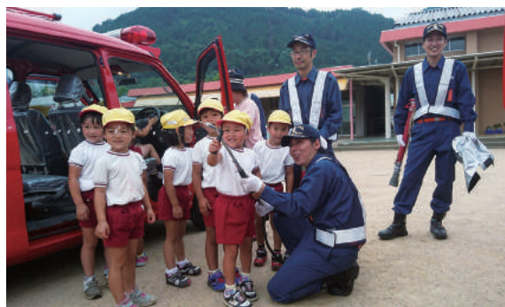
綾部分団では毎年、綾部幼稚園の避難訓練で火の用心を啓発。消防団は、分団ごとに地域密着の火災予防活動をしています。