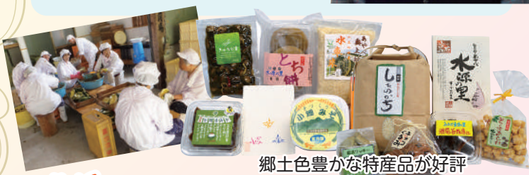
郷土色豊かな特産品が好評