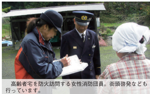
高齢者宅を防火訪問する女性消防団員。街頭啓発なども行っています。

住宅用火災警報器。点検用のひもを引くなどして音が鳴るか確認してください。また、製造年等の表示を見て、10年を経過している場合は交換しましょう。万一、未設置の場合は台所と階段、寝室へ直ちに設置してください。