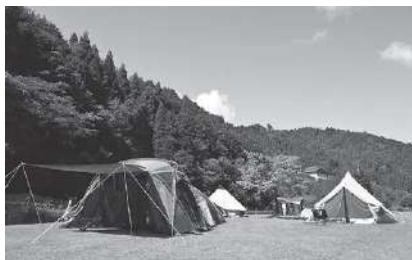
豊かな自然に囲まれたキャンプサイト。キャンプ用品の貸し出しもあり手ぶらで楽しめます

昨期も、コロナの感染拡大と行動規制の影響を受け、苦しい1年となりました。そうした中でも、国や府、市等による経営支援を最大限に活用し、赤字の圧縮に努めました。また、市からの補助金で設備の整備を実施。多くを固定資産として計上した結果、黒字となりました。