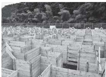
令和3年3月にオープンした大型迷路の総面積は1300㎡。関西最大級です

今期もコロナの影響が残る中で、原材料費や燃料費の高騰など、厳しい経済状況が予想されます。しかし、アフターコロナを見据えた「遊べる温泉」のキャッチフレーズのもと、キャンプサイトの利用拡大や広報の拡充等を強化。また、市が昨年度に実施した緑土経営診断に基づきながら、収益性が低い部門については、大胆な再編や業務の効率化などで、持続可能な経営を目指します。