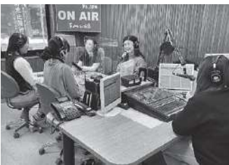
1年間の感謝を込めて送る年末特別番組

昨期は4年間続いた環境省の脱炭素社会の啓発事業COOLCHOICEが終わり、厳しいスタートとなりました。しかし、コロナで無観客イベントが増える中、パブリック競歩市探火式やハイブリッド型イベント、各種講演会