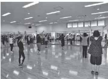
広々としたスタジオでは、ダンスやヨガなどを楽しめます

染拡大防止ガイドラインに基づき運営するなど、安心・安全に利用できる施設運営に努めました。