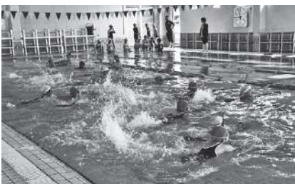
西八田小学校と志賀小学校が5月13日から、水夢での水泳学習を開始

昨期も、コロナによる休業要請を受け、全館休業や時短営業を余儀なくされました。その影響などで会員数が減少。令和3年度末の会員数は、前期比15人減の131人となりました。営業時は、感