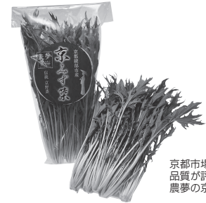
京都市場でも高い品質が評価されている農夢の京みず菜

昨期は平成30年7月豪雨の被害を受けた生産設備もおおむね復旧。しかし、京みず菜を中心とした出荷量が122・8ト（計画比79％）と大幅に減少しました。これは猛暑と害虫の発生、冬季の市場価格低迷などが影響したことが原因です。次の猛暑に向け、同社はビニールハウスに使用する遮熱資材を増設。京みず菜の生育不良を解消し、生産性の向上を目指します。 今期は売り上げ回復に向けて新たな品目を導入。土壌改良や施設改善も視野に入れ、夏季・冬季の安定した出荷体制を目指します。