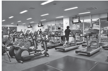
感染症対策に、器具の間隔を空けるよう配置を変更

会員の水泳選手コースから1人が、ジュニアオリンピックに出場。認知度が高まり、スイミング教室は7人増、体操教室も1人増となりました。 今期は市立病院と連携した運動療法教室や市内企業での身体スキル測定会を実施。新型コロナウイルスの感染拡大の影響による会員減少の早期回復を目指し、安全・安心な施設づくりや会員獲得につながる仕組みづくりに取り組めます。