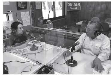
感染症対策にアクリル板を設置して放送

に合わせた、地域密着型の取材を積極的に行いました。 今期は新型コロナウイルスの影響で、イベントや広告の減少による収入減が予想されます。新規スポンサーへの提案営業や福知山、舞鶴のFM局と連携した番組の企画提案などで受注増を目指します。 今後も「わが町の放送局」として、情報発信やイベントの司会・音響、ドローンを使用した映像制作などを実施。地域に必要とされる事業に取り組みます。