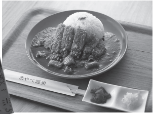
あやべ温泉のレストランで提供している二王門赤カレー。レトルト商品も販売しています

前期は、一昨年に行った大規模リニューアルの効果が最大限に生かすため、二王門赤カレーII写真左IIの販売や増税前の価格で入浴できるプラチナ回数券の販売などを実施。来客が少ない冬場は、無