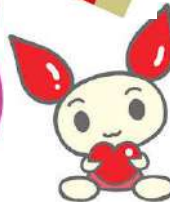
献血推進キャラクター けんけつちゃん

新型コロナウイルス感染症の影響で、献血協力者が減少しています。この状況が続くと、医療機関への安定的な輸血用血液の供給に支障をきたす恐れがあります。