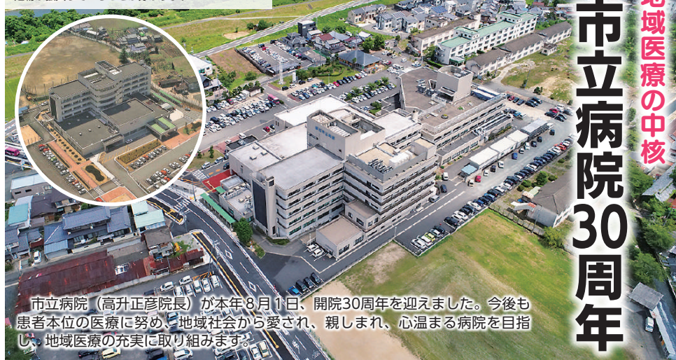
開院当時の全景=写真左=と比べると、増改築により建物が拡大していることが分かります

https://www.yurugp.jp/jp/vote/detail.php?id=00000674