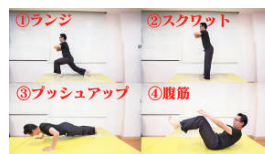
手軽にできる筋力トレーニングや栄養、最新の医療研究などを紹介しています

URL: https://www.youtube.com/c/KuromameAyabeDiabetes