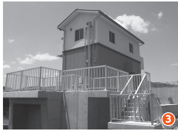
①市民センターの完成 ②市役所窓口にも音声で文字にするシステムを導入 ③延町に雨水ポンプ場を整備(～令和3年度)