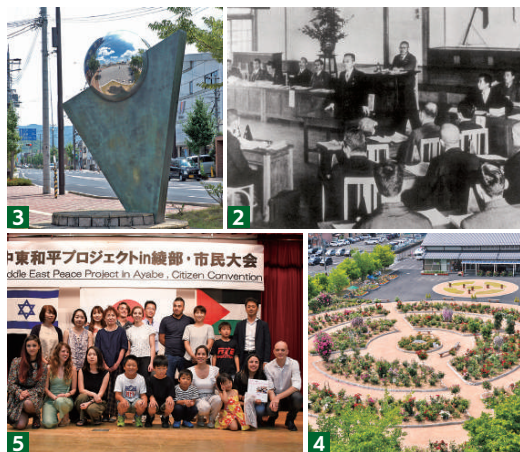
1 市民の浄財により紫水ヶ丘に平和塔を建立（昭和27年） 2 臨時市議会を開き宣言を全会一致で可決（昭和25年） 3 JR綾部駅南口に平和のモニュメントを設置（平成12年） 4 世界連邦マークをかたどりアンネのバラを配した綾部バラ園を整備（平成22年） 5 本市で3度目となる中東和平プロジェクトを開催（令和元年）

陸寄町の国宝光明寺二王門と重要文化財の金剛力士立像が、第2669回近畿宝くじの図柄に使用されます。宝くじは、近畿の2府4県4政令指定都市で11月4日に発売開始です。宝くじの収益金は、自治体の住みよいまちづくりに使われます。