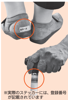
※実際のステッカーには、登録番号が記載されています

警察で共有し、行方不明発生との連絡があった場合のみ使用します。安心して登録ください。 掛けたら、変わったところがないか見守ること。道に迷ったり、困ったりしている様子があれば▽驚かせないよう正面から目を見て声を掛ける▽優しい口調で話す▽水分補給や休憩を促すーなどで落ち着いてください。皆さんの見守りが、事故の防止や行方不明者の早期発見につながります。ご協力をお願いします。