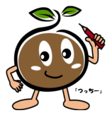
農林業センサスキャラクター「つっちー」

農林水産省 農林業センサスホームページ http://www.maff.go.jp/j/tokei/census/afc/