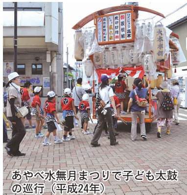
あやべ水無月まつりで子ども太鼓の 巡行(平成24年)