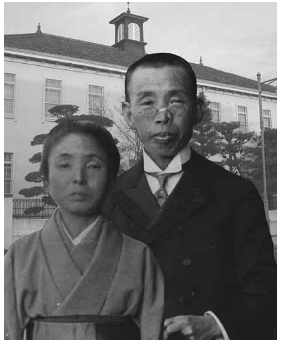
グンゼ創業者の波多野鶴吉とその妻はな。人間愛に満ちあふれたドラマチックな生涯をドラマ化しようと、活動が展開されている

昨年7月に悲願の京都縦貫自動車道が全線開通し、ヒト・モノの動きが活発になっています。市の魅力をPRし、さらなる定住交流施策につなげ「綾部創生」の実現を目指すため、現在、NHK朝の連続テレビ小説（通称・朝ドラ）を誘致しようとする運動が展開されています。