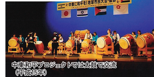
中丹和平プロジェクトでは太鼓で交流 (平成15年)