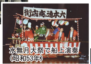
水無月大祭で船上演奏 (昭和53年)