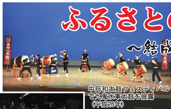
中丹和太鼓フェスティバル で九鬼水軍太鼓を披露 (平成26年)