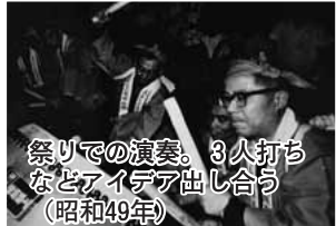
祭りでの演奏。3人打ち などアイデア出し合う (昭和49年)

昭和55年には市内の団体で構成する綾部市太鼓連合会が設立され、その中核としても活躍しています。