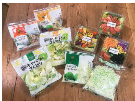
年間1,000点以上の商品の試作・開発をしています