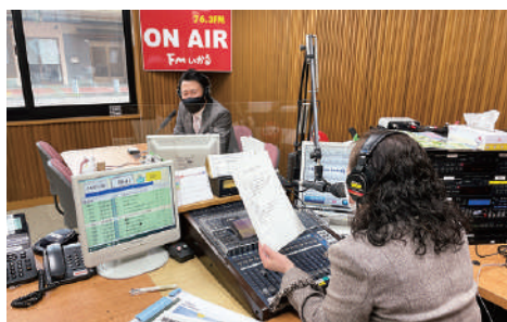
FMいかるで、白井社長出演の新番組がスタート。市内の経営者などと対談します。詳しくはFMいかるホームページへ

今回、ものづくり交流館の展示では、同社の商品や会社概要についてパネルやサンプルで紹介します。ぜひご来館ください。 なお、採用情報などについて、詳しくは同社にお問い合わせください。