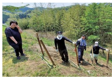
約2万4千平方メートルの広大な敷地を緑地化。春は美しい千本桜が咲きます

市場も急成長しており、綾部工場では増産に向けて設備の拡充を図り、増員のための中途採用を積極的に行っています。最先端技術に使用される半導体用パッケージは、あまり人目に触れる部品ではありませんので、この機会にぜひご覧ください。