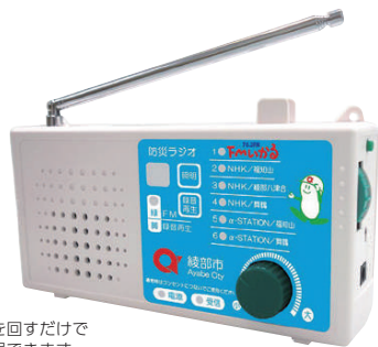
ダイヤルを回すだけで簡単に選局できます

当病院で2年間の臨床研修を経て、糖尿病内科医として勤務します。最適な医療を提供し、地域医療に貢献したいと思っております。精一杯頑張りますので、よろしくお願いいたします。