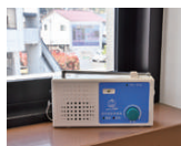
①窓辺などよく聞こえる場所を探す

ラジオが入る地域でも、周囲の状況等で聞こえにくい場所も。そんなときは、少しの工夫で受信改善する場合があります。