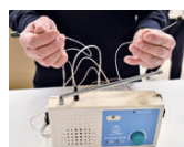
④市販の簡易アンテナを接続する