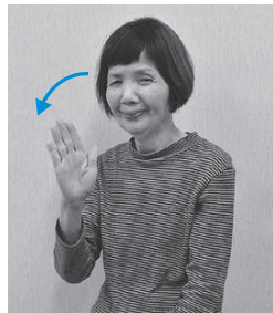
手を開き、同時に頭を下げます