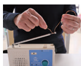
③アンテナに針金を巻く