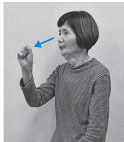
鼻先に置いたこぶしを前へ突き出してから