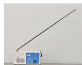
②アンテナを98センチに伸ばす