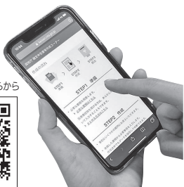
スマートフォンでの申告書作成はこちらから

国税庁ホームページの「確定申告書作成コーナー」では、画面の案内に従って入力するだけで、簡単に確定申告