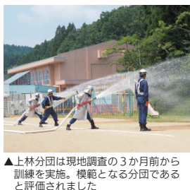
▲上林分団は現地調査の3か月前から訓練を実施。模範となる分団であると評価されました

災害時の救助や啓発に尽力 市消防団は、地域の安全と安心を守るために活動する市町村の消防機関です。各地区分団員や女性消防団員など835人（本年1月1日現在）で構成しています。 団員は、訓練や研修などを行い、消防・防災の知識や技術を習得。火災や災害発生時の消火・救助活動、避難誘導などを行います。また、防火・防災の啓発活動として▽消防出初式▽住宅防火訪問▽消火器などの取り扱い訓練などを実施。地域の防災リーダーとして、重要な役割を担っています。