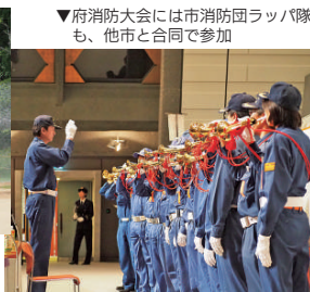
▼府消防大会には市消防団ラッパ隊も、他市と合同で参加

防火啓発活動を中心に行っている女性消防団員「シルキーファイヤー」▽イベントなどで活躍する「ラッパ隊」▽特殊技能の資格を活かし、災害時の状況に応じて活動する「ハイパー消防団員」などがあります。また、「綾部市消防団応援の店」の取り組みでは、加入店が消防団員へ料金の割引などのさまざまな特典を提供。地域を挙げて、消防団員を支える体制を整えています。