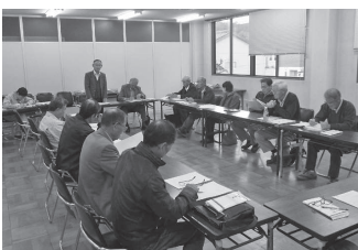
農業者と意見交換会を行い、農業の将来を話し合います

農地利用最適化推進委員Ⅱ担当区域の京丹農場プランづくりに関する話し合い活動への参画▽農地の利用状況調査や利用意向調査による農地の出し手と受け手の意向把握▽担い手への農地の利用集積一などを行います。