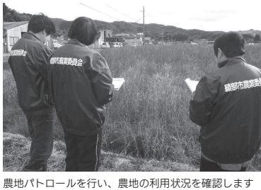
農地パトロールを行い、農地の利用状況を確認します

農地利用最適化推進委員Ⅱ担当区域の京丹農場プランづくりに関する話し合い活動への参画▽農地の利用状況調査や利用意向調査による農地の出し手と受け手の意向把握▽担い手への農地の利用集積一などを行います。