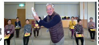
活動量計ご当選 Nさん