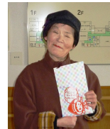
ランチジャーご当選 Aさん

友達から聞いてポイントを貯めました。とっても楽しかったです。これからも自分の力で歩いて皆と楽しくおしゃべりができるように頑張りたいです。