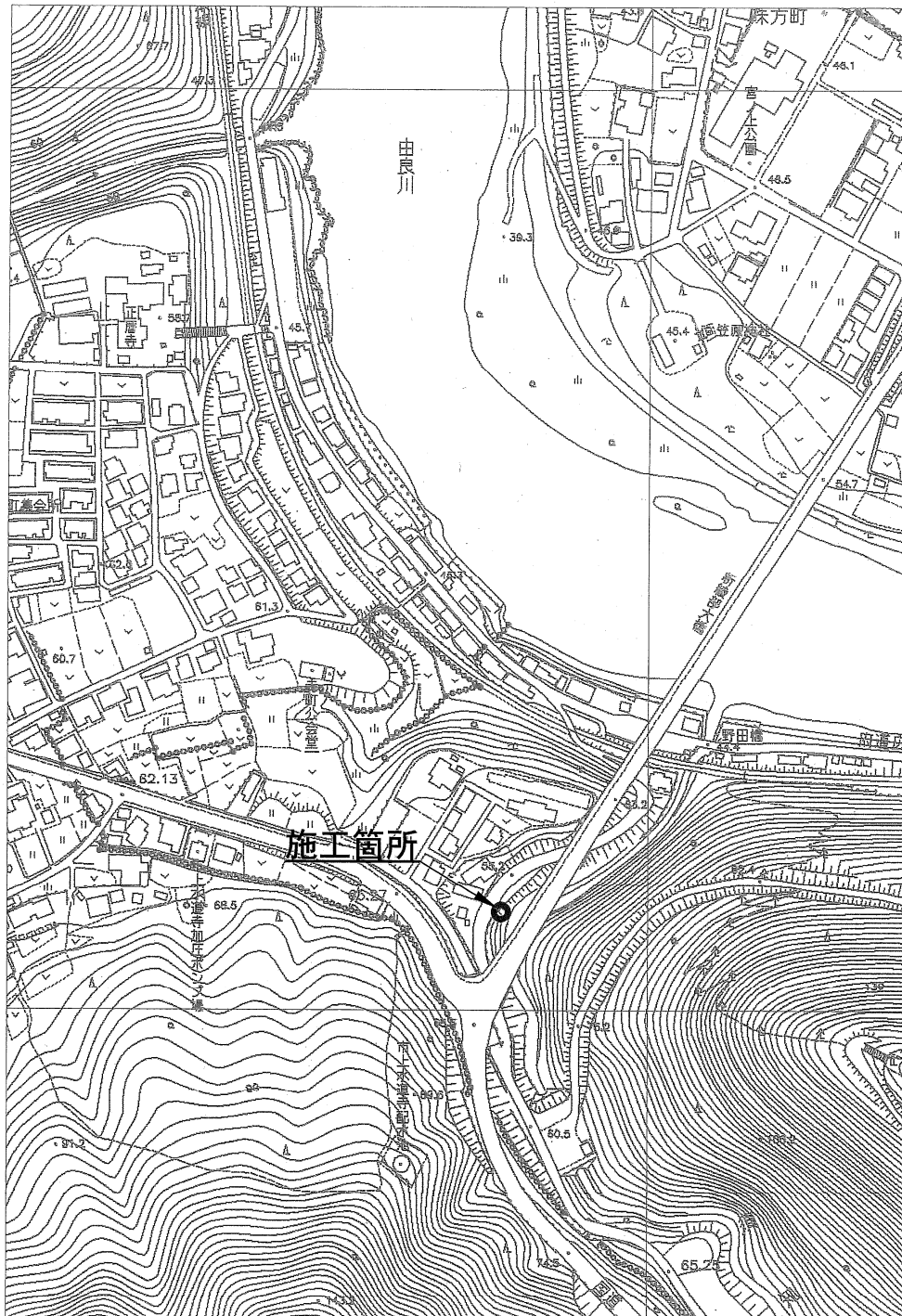
マンホールポンプ設置 (29-5) 工事