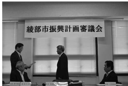
綾部市振興計画審議会への諮問

綾部市振興計画に関する規則第10条の規定に基づき、第5次綾部市総合計画後期基本計画について、貴審議会の意見を求めます。