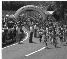
あやべ二王門登山レース