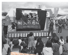
シルキーファイヤー