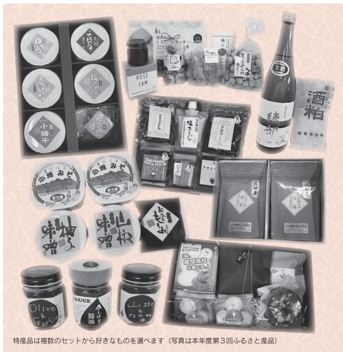
特産品は複数のセットから好きなものを選びます（写真は本年度第3回ふるさと産品）

本市出身者やゆかりのある人などに、本市を応援していただく「あやべ特別市民制度」。会員には、特産品の詰め合わせなど「ふるさとの味」とともに、会報やメールマガジンで市の情報を届けています。本年度の会員は約1800人。ぜひ会員になって、綾部を応援してください。