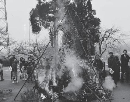
持ち寄った書初めやしめ縄などを燃やし、1年間の無病息災や家内安全を祈願します