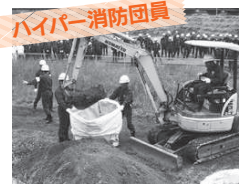
ハイパー消防団員

重機の操縦や電気工事士など、専門的な技術や資格がある団員。災害現場で特殊な機材等が必要になったときに活動する、全国的にも珍しい制度です。