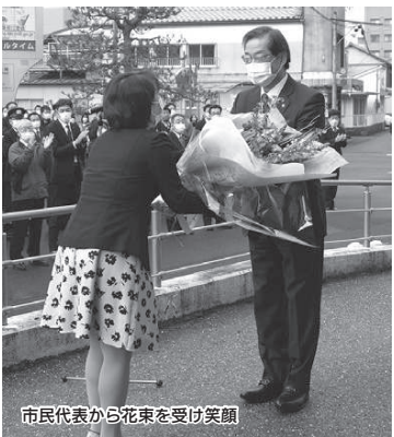
市民代表から花束を受け笑顔