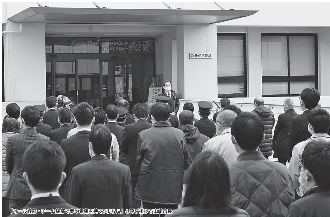
「オール綾部・チーム綾部で夢や希望を持てるまちに」と呼び掛ける山崎市長