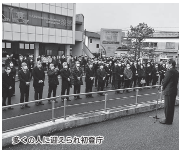
多くの人に迎えられ初登庁