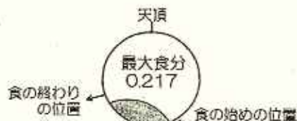
食の始め・終わりの位置と最大時の様子

小さな鏡で太陽の光を反射させて少し離れた壁に映す。 (小さい鏡がない時は紙などで隠して小さくするとよい)