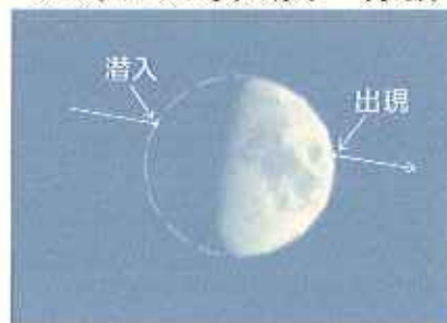
京都での潜入・出現時刻と月の高度