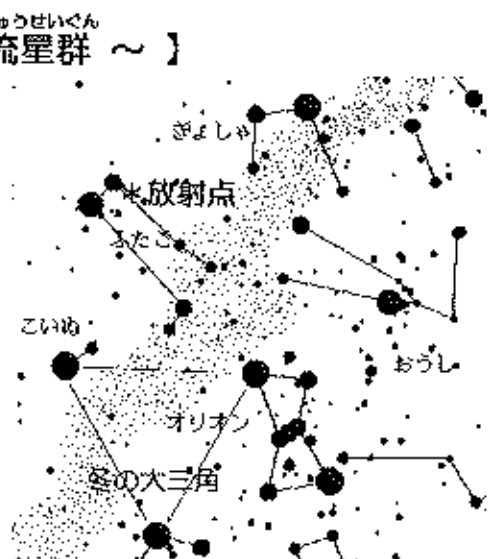
【ふたご座流星群の放射点付近】

放射点は流れ出す方向の中心となる点ですが、流れ星は空のどの場所でも流れる可能性があります。できるだけ空が開けた暗い場所で観察するのが、たくさんの流れ星をみるコツです。そして、寒い季節ですので暖かくして観察してください。11月につづき、12月も流星群に注目です。