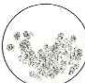
9月28日 視直径 33.8分 (今年のスーパームーン)