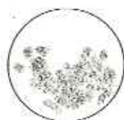
3月6日 視直径 29.7分

並べて見るとわかりますが、片方ずつ 見たのではわかりません。 この大きさの変化は、月が地球を回る 軌道が円ではなく楕円なので、月と地球 の距離が変化するために起こります。月 が地球に近いと、月は大きく見えます。遠 いと小さく見えます。近い時に満月にな ると、大きく見えるスーパームーンとな ります。