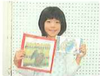
11月の工作教室の様子。《水切り絵》・《モーター工作》