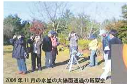
2006年11月の水星の太陽面通過の観望会