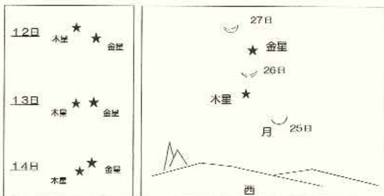
◆西の空の明るい星に注目◆