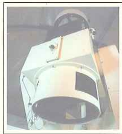
メンテナンス中の95cm反射望遠鏡