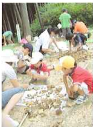
化石採集体験教室