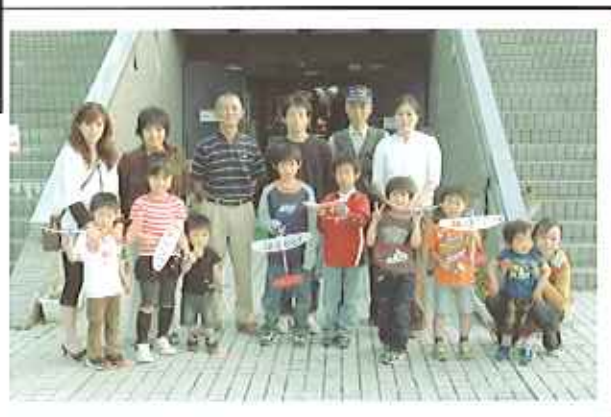
みんなの力作が大空へ羽ばたきました。 「プロペラ飛行機作り(5月23日)」

綾部市天文館の情報は、携帯電話(iE-D)からも見るができます。 http://www.obs.ayabe.kyoto.jp/astro/im/index-i.html