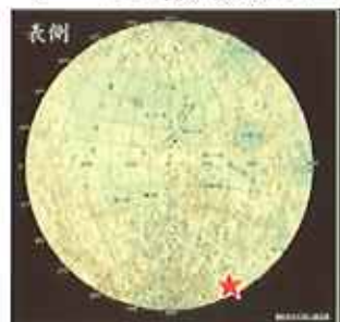
(図:JAXAホームページより)