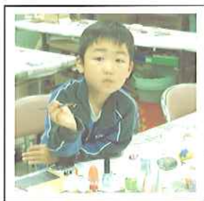
すてきな石の飾りができたよ。 自由工作「石と遊ぼう(5月16日)」