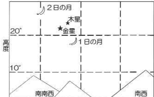
↑ 12月1日と2日の日没頃の空

この2つの惑星が徐々に近づいていき、12月1日に最も接近します。それだけでもよく目立ちますが、1日、2日にはこれに細い月も加わります。思わず目をうばわれる光景となるでしょう。