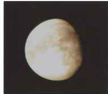
製作した望遠鏡で撮影した月

綾部市天文館の情報は、携帯電話(iE-D)からも見ることができます。 http://www.obs.ayabe.kyoto.jp/astro/im/index-i.html