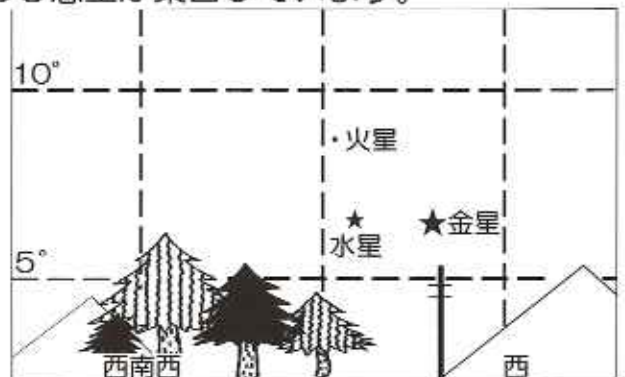
↑ 9月上旬日没約30分後の西空

ただし、日没30分後の高度は6度程しかない ので、西の空が開けたところで、ちょっとがんばって探さないと分からないでしょう。まず一番明るい金星を見つけて、その近くを双眼鏡でよく探すと水星、火星が光っているのが分かります。それぞれの惑星の位置は毎日少しずつ変わっていきますので、その変化を追いかけるのも面白いでしょう。