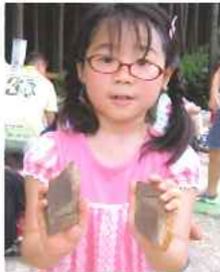
化石採集体験教室